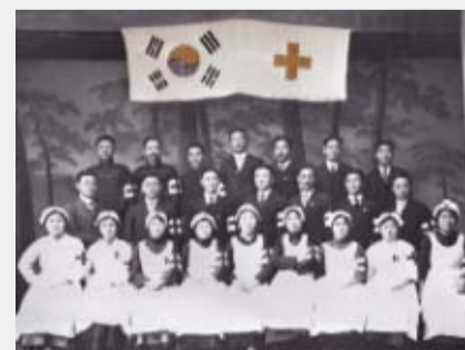
(대한적십자회 간호원 양성소)